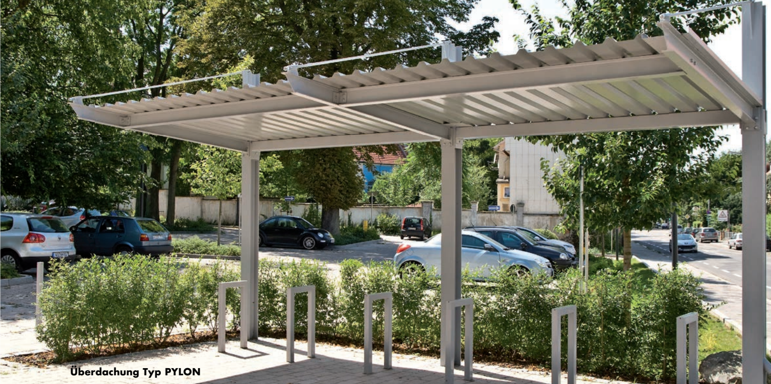
Überdachung Typ PYLON