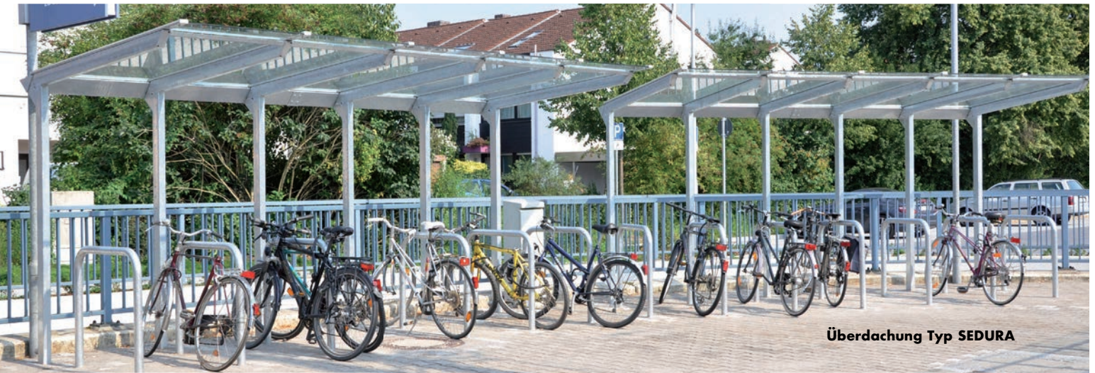
Überdachung Typ SEDURA