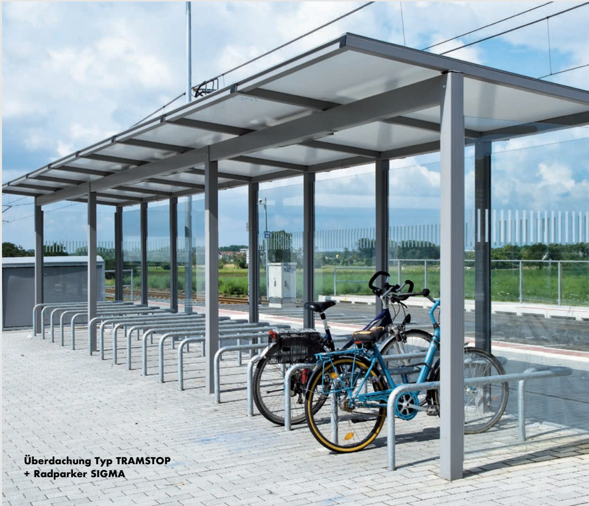
Überdachung Typ TRAMSTOP + Radparker SIGMA