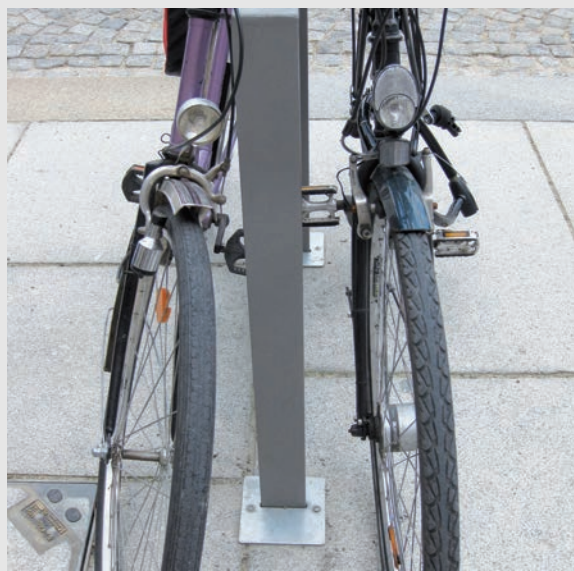
Anlehnbügel Typ PARIS mit Bodenhülse zur "mobilen Verankerung".