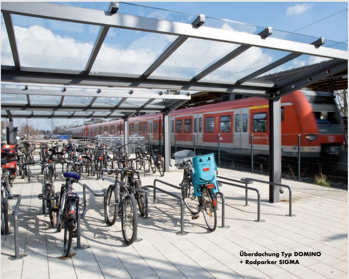
Überdachung Typ DOMINO + Radparker SIGMA