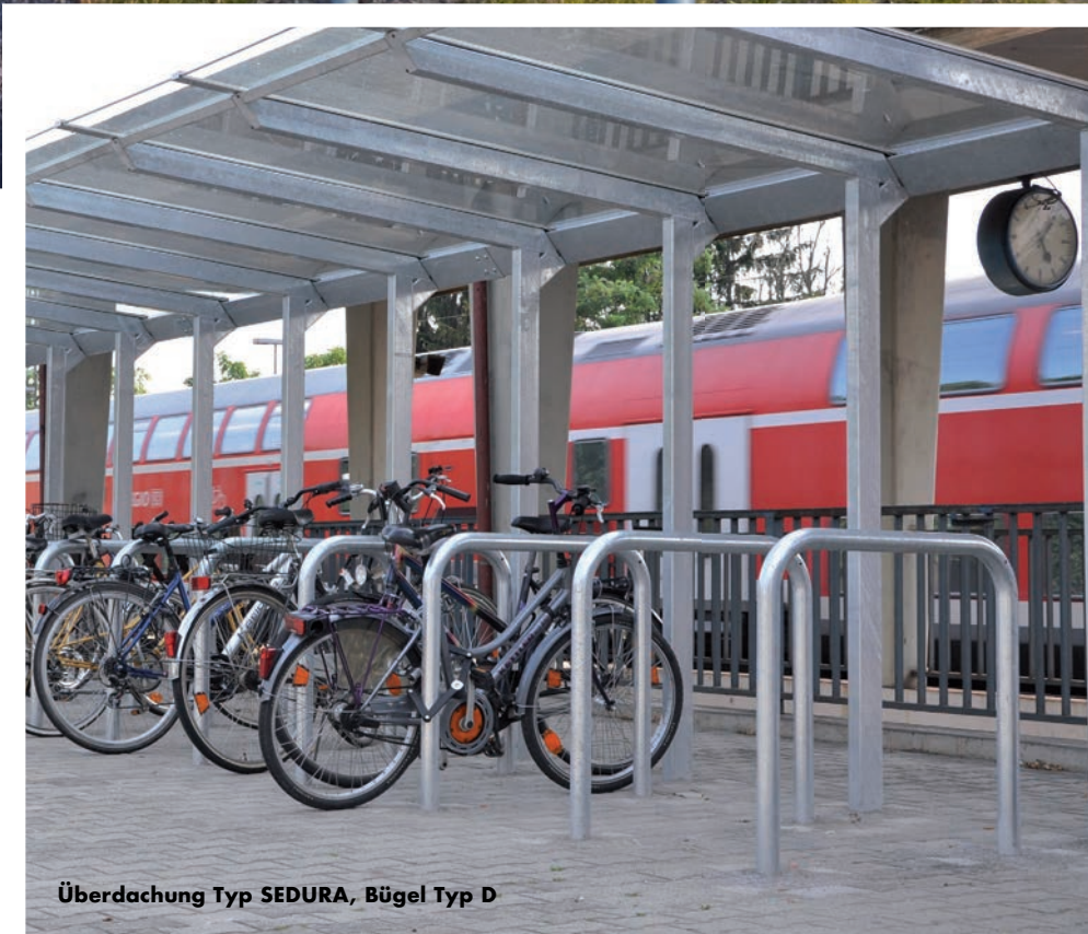
Überdachung Typ SEDURA, Bügel Typ D