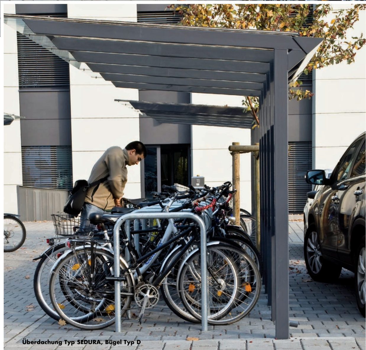
Überdachung Typ SEDURA, Bügel Typ D