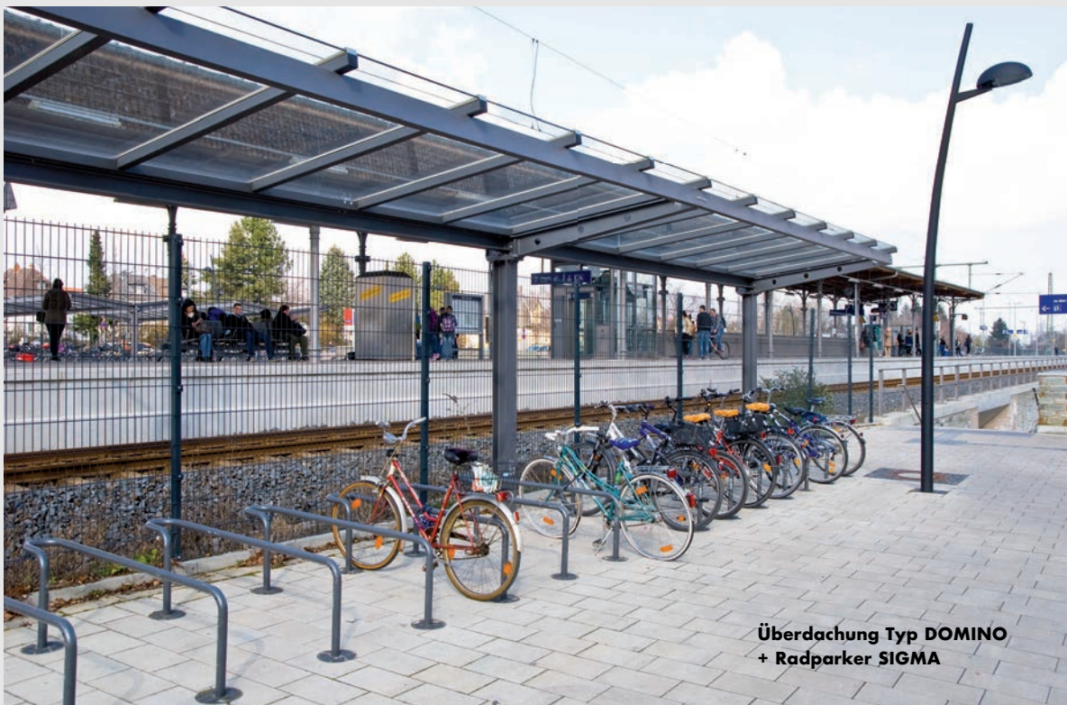
Überdachung Typ DOMINO + Radparker SIGMA