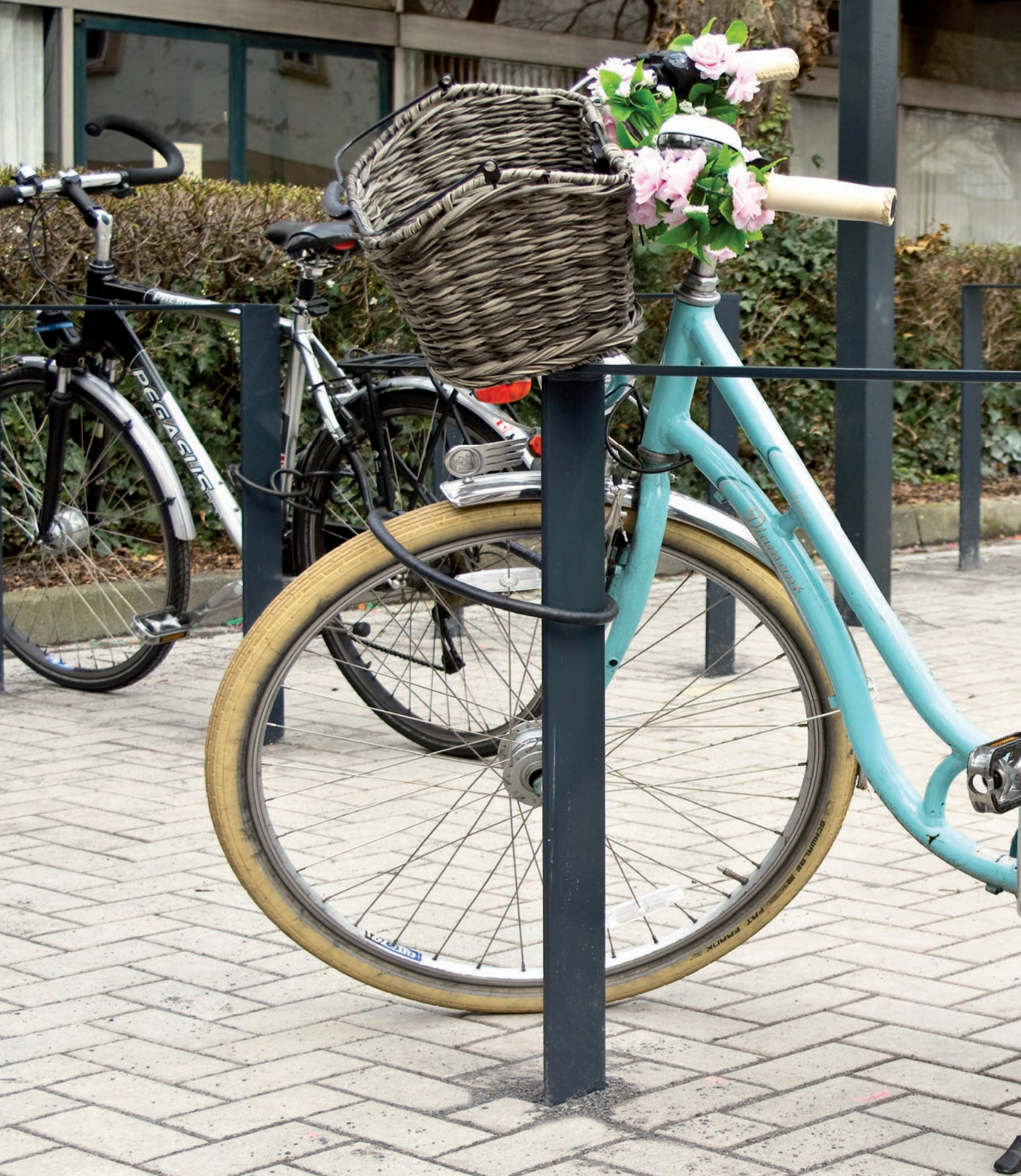
Bügel Typ PARIS