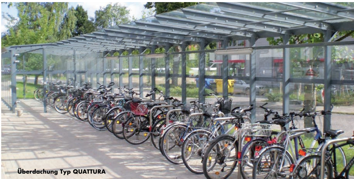
Überdachung Typ QUATTURA